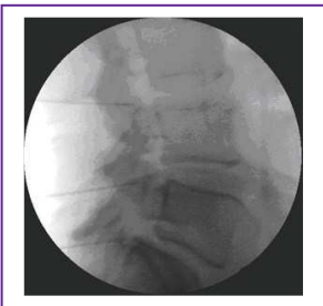
A: Radiofrequentie Facet Lumbaal

De omgeving van deze plaats wordt door de verpleegkundige ontsmet met een koude, rode ontsmettingsstof. Vervolgens legt de arts enkele steriele doeken rond de prikplaats om steriel te kunnen werken. De huid wordt plaatselijk verdoofd. Dit kan een brandend, spannend gevoel geven, dat snel wegtrekt.